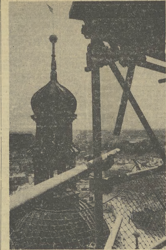
Zdjęte z wieży hejnałnej kościoła Mariackiego w Krakowie korona i bania zostały w PKZ-ach w Warszawie oczyszczone i zakonserwowane. Po powrocie do Krakowa w tutejszych PKZ-ach pokrywa się je kilkoma warstwami zabezpieczającymi, przed położeniem nowych plątków złota. Po wszystkich tych zabiegach korona i bania wróca na szczyt hejnałnej wieży, która nadal znajduje się w remoncie. Zdjęcie wykonane zostało z rusztowań na wieży z widokiem na stary Kraków, Wawel i Wisłę.