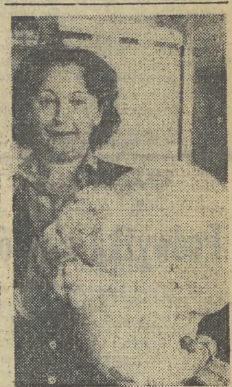
Ten ogromny grzyb gatunku Vesca (Maxum), znaleziony został na wsi pod Mediolanem. Niezwykle okaz waży 5,2 kg.

czasowych stanowiskach; 25 proc. przeszło do pracy cięższej. Ogólny stan zdrowia u 30 proc. pacjentów jest lepszy niż przed przebytym zawałem, co wiąże się ze znaczną poprawą funkcjonowania układu krążenia. Naukowcy AM podkreślają, że uzyskanie tych wyników było możliwe jedynie przy współpracy zespołu lekarskiego z psychologami i socjologami, którzy pozwalają wierzyć w możliwość odzyskania pełnej sprawności fizycznej i przydatności społecznej.