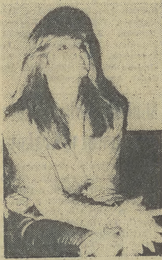
Farah Fawcett, która oglądamy w telewizyjnych „Aniolkach Charliego”, zagra z Kirkiem Douglasem w realizowanym w Wielkiej Brytanii filmie fantastyczno-naukowym „Seturn Trzy”. Warto dodać, że ta najpopularniejsza modelka amerykańska i ostatnio także wzięta aktorka, rozwiodła się z mężem i zrezygnowała z drugiego członka swego nazwiska

W sobotę podczas pierwszego konsystorza swego pontyfikatu Papież Jan Paweł II dokonał uroczystego wyniesienia do godności kardynalskiej 14 nowych kardynałów. Wśród nowych kardynałów znajduje się dwóch Polaków: metropolita krakowski — arcybiskup Franciszek Macharski i sekretarz generalny Świątobłego Synodu, Biskupów — biskup Władysław Rubin. 10 z 14 nowych kardynałów to kardynałowie z Europy, wśród nich jest 6 Włochów, m. in. sekretarz stanu Agostino Casaroli. 2 kardynałów pochodzi z Azji (m. in. arcybiskup Hanoi, Joseph-Marie Trinh Van Can), 2 z Ameryki. Liczba członków kolegium kardynalskiego, uprawnionych do udziału w konklawe, wzrosła w ten sposób do 121.