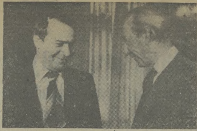
Sekretarz generalny ONZ Kurt Waldheim (z prawej) i minister spraw zagranicznych Iranu Sadek Ghotbzadeh.

W Jugosławii zapnowała zima. Wprawdzie wszystkie główne drogi są przejezdne, ale w