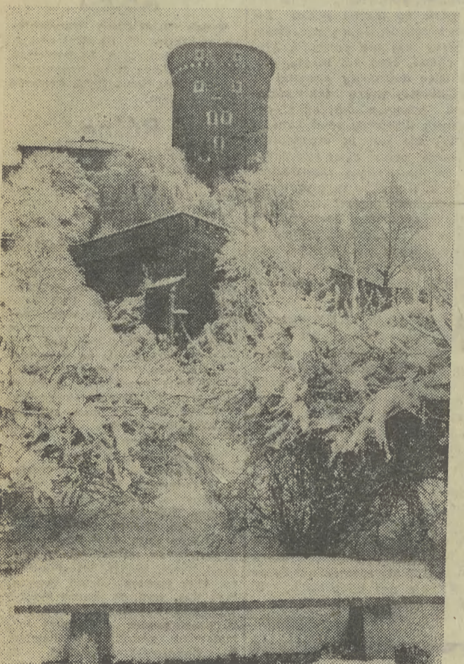
Laweczka musi poczekać do wiosny...