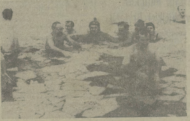
„Ludzie-morsy” z Karl-Marx-Stadt uprawiają dwa razy w tygodniu kąpiel w skutym lodem basenie.

J utro pogoda w rejonie Krakowa kształtować się będzie w zasięgu klimatu wyjątkowo. Zachmurzenie umiarkowane, okresami duże. Rano silne zamglenia. W ciągu dnia słabe opady śniegu. Wiatr zachodni i północno-zachodni, prędkość 2-5 m/s. Temperatura maksymalna dniami minus 4-7 st. C., minimalna nocą od minus 4-7 st. C.; przy rozpozgodzeniu spadek temperatury lokalnie do minus 10.