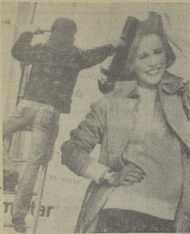
Ten pan na drabinie nie trzyma w ręku szeszałki do włosów, lecz pędzel do klejenia plakatów...