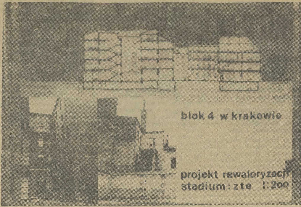
Po przedstawieniu nowych osiedli Międzyzakładowy Klub Techniki i Racjonalizacji Przem. Budowlanego przy ZG PZITB (ul. św. Jana 20) miał znowu dobry pomysł organizując wystawę pt. Kompleksowy projekt odnowy staromiejskiego bloku nr 4. Arch. B. Beronki zaprezentował budowlę w stanie obecnym i po odrestaurowaniu. Na zdjęciu: jeden z fragmentów bloku teraz i w przyszłości.

Nie odpowiadające normom mydło „Parys” zostało decyzją ministra handlu wewnętrznego wycofane ze sprzedaży. Więc jak to się dzieje, że sklepy (np. drogeria przy pl. Mariackim) nadal oferują je klientom? (mar)