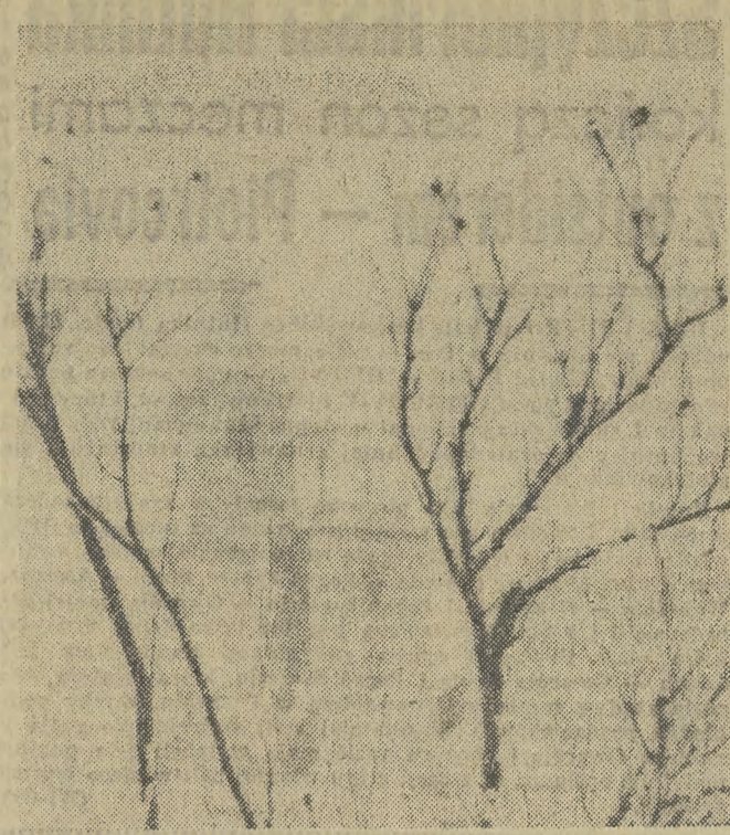
W marcowy, mglisty, krakowski poranek...

Pokrzywdzeni proszeni są o zgłaszanie się w Komendzie Dzielnicowej MO Krowodrza w Krakowie, ul. Batoro 25, pokój nr 13, tel. 233-22, wewn. 723.