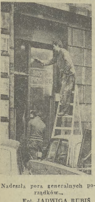
Nadeszła pora generalnych porządków...

Krakowianie od lat przez złośliwców nazywani są centusiami, skąpstwo i inne drobniosteczkaństwo przywary łączone są z postacią pani Dulskiej i tak już zostało... W ostatnich kilkunastu latach do tych już legendarnych negatywnych cech doszły następne, może drobniejsze, ale zaryzykowałbym stwierdzenie, że bardziej dokuczliwe. Po pierwsze wychodzenie z kina w momencie, kiedy na ekranie rozgrywa się ostatnie sekwencje filmu, albo „leci” spis aktorów, autorów i realizatorów. Po drugie nagminne wsiadanie i wysiadanie z miejskich autobusów i tramwajów tym samym pomostem. (Dopomógł temu MPK wprowadzając swojego czasu zupełną dowolność w tym zakresie). I po trzecie, to co chyba najbardziej ostatnio irytuje: uchodzenie do sklepów i innych pomieszczeń publicznych na się zanim opuszczający je zdołają przekroczyć próg. Nie liczy się tutaj zasada, że aby ktoś mógł wejść, ktoś inny musi najpierw wyjść (szczególnie w małych sklepikach). Ten ma pierwszeństwo kto jest silniejszy, ma większą tupet, święcej tupetu... I nie ma w tym postępowaniu reguły — tak samo wbrew logice postępują nastolatki, jak i ludzie, którzy zapewne pamiętają czasy, kiedy przed niemal każdymi drzwiami rozgrywała się scenka w stylu: — Ależ proszę bardzo. — Nie pan ma pierwszeństwo, panie przesie. — Proszę bardzo. — Ależ panie dobrodzieju, ja nie mogę przed panem... (jb)