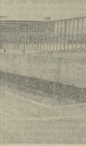
Większość prac przy przejściu podziemnym została już zakończona.

...ale w dalszym ciągu brakuje znaczków pocztowych o nominalnej odpowiadającym aktualnie obowiązującej taryfie pocztowej.