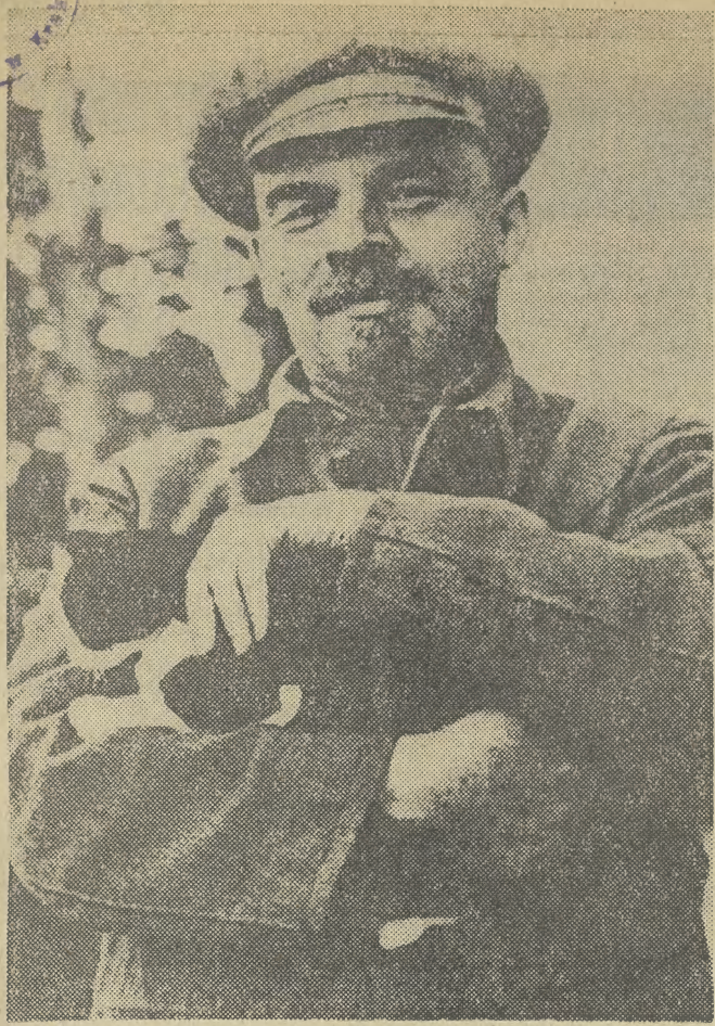
W 110. rocznicę urodzin W. I. Lenina