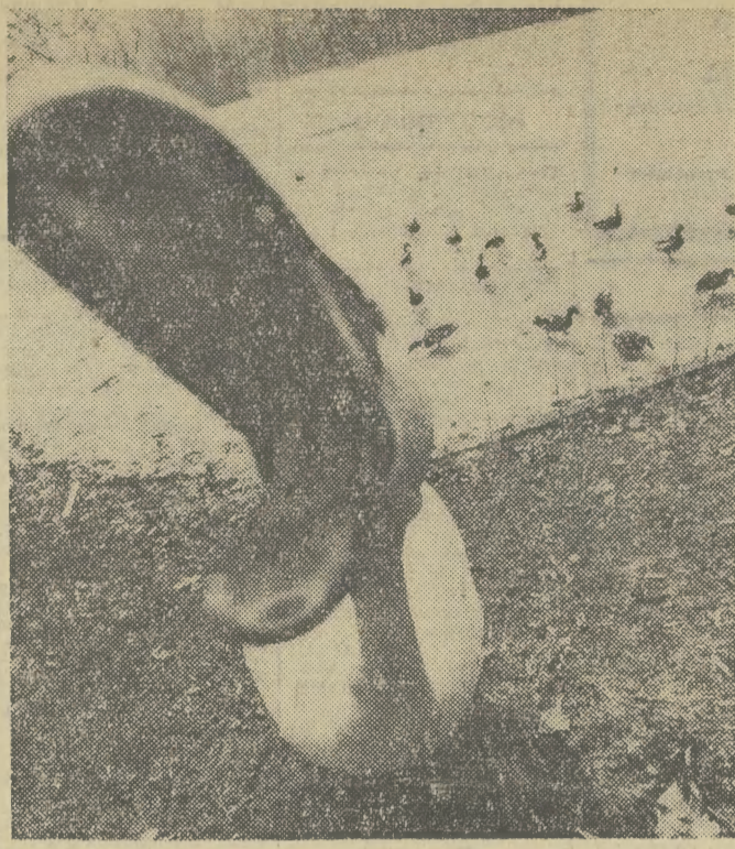
Czyżby potwór z Loch Ness przeniósł się do warszawskich Łazienek?