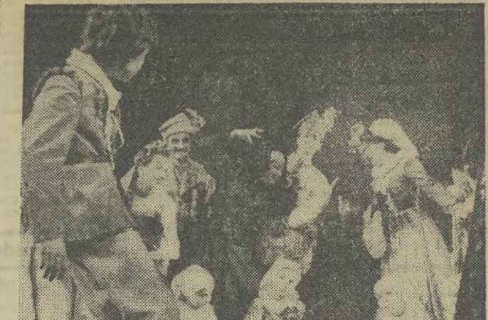
„Opowieść o Mistrzu Twardowskim” — to tytuł spektaklu baletowego jaki wstąpił od poniedziałku na afisz Teatru Muzycznego...