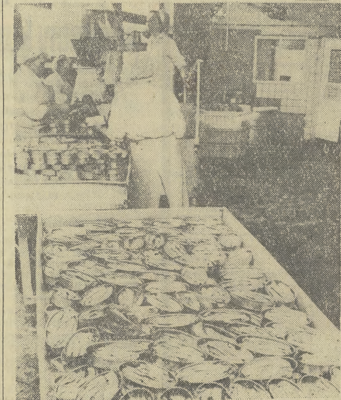
Już za kilka dni te konserwy znajdą się na sklepowych półkach.

Krakowska Centrala ma w planie produkcję około 20 asortymentów. Najpopularniejszymi obecnie rybami są: mintaj, kargulena, sardynela, szprotka, białokitek, śledź bałtycki, ostrobok, tołpyga. Obok klasycznych już konserw w oleju w ubiegłym roku wprowadzono marynaty w tzw. kolorowych sosach: majonezowym, majonezowo-musztardowym, pomidorowym pikantnym i słodkim. (es)