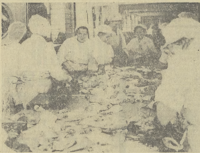
Patroszenie karpia wymaga zręczności i dokładności.