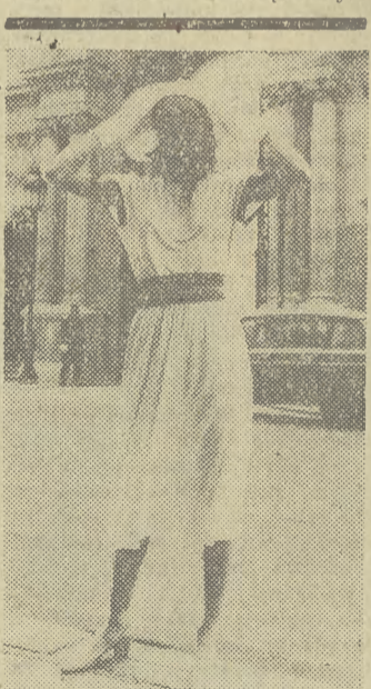
Oto jedna z propozycji na lato — jasna sukienka z dżerseju z kolorowymi aplikacjami — z kolekcji Louisa Ferrauda.