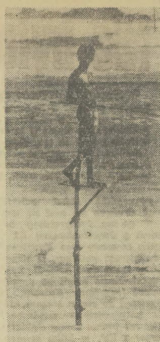
W porze monsunów, gdy nie można łodzi wyprowadzać w morze, rybacy ze Sri Lanki łowią... na szczydach.