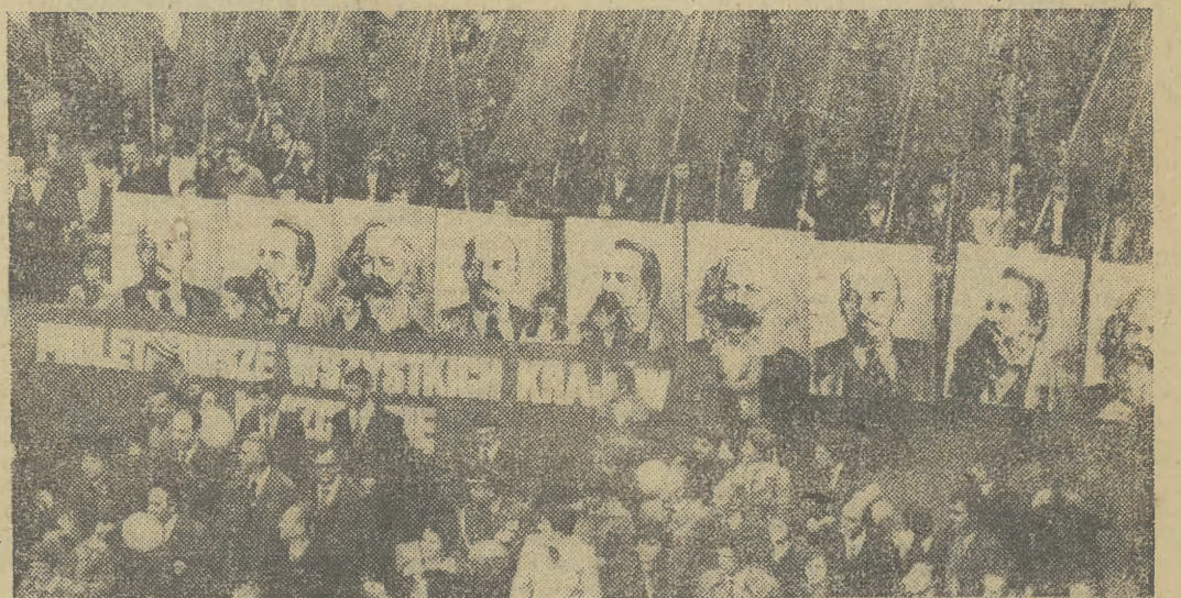
Przed trybuną honorową kolumna Podgórze.