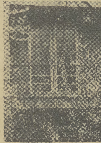
Publikując to zdjęcie pięknie kwitnącej moreli przed jedną z willi przy ul. Grochowskiej, mamy nadzieję, że nadejście prawdziwej wiosny obwieścimy po raz ostatni. (k)

U TRÓ pogoda w rejonie Krakowa kształtować się będzie na skrajnie wyci. Zachmurzenie umiarkowane, przejściowo duże. Rano mgły i zamglenia. W ciągu dnia przelotne opady deszczu. W godzinach popołudniowych możliwość wystąpienia burz. Wiatr północno-wschodni i wschodni 3-8 m/s. Temperatura maksymalna dniami plus 11-14, minimalna nocą plus 5-2 st. C.