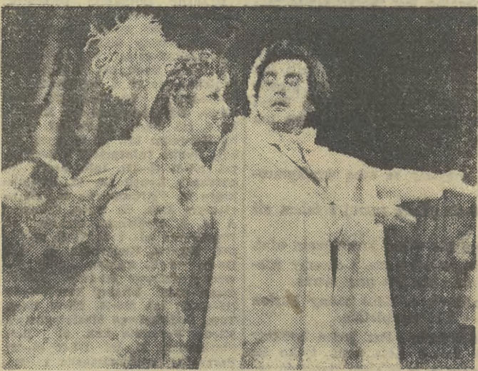
Po wakacyjnej przerwie rozpoczyna w środę 6 sierpnia br. Krakowski Teatr Muzyczny przedstawienia operetki „Polska król” Oskara Nedbala.

Niemalą sensację wzbudził ostatnio na placu targowym (Rynek Klepariski) olbrzymi borowik oferowany przez sprzedawczynię za... 100 zł.