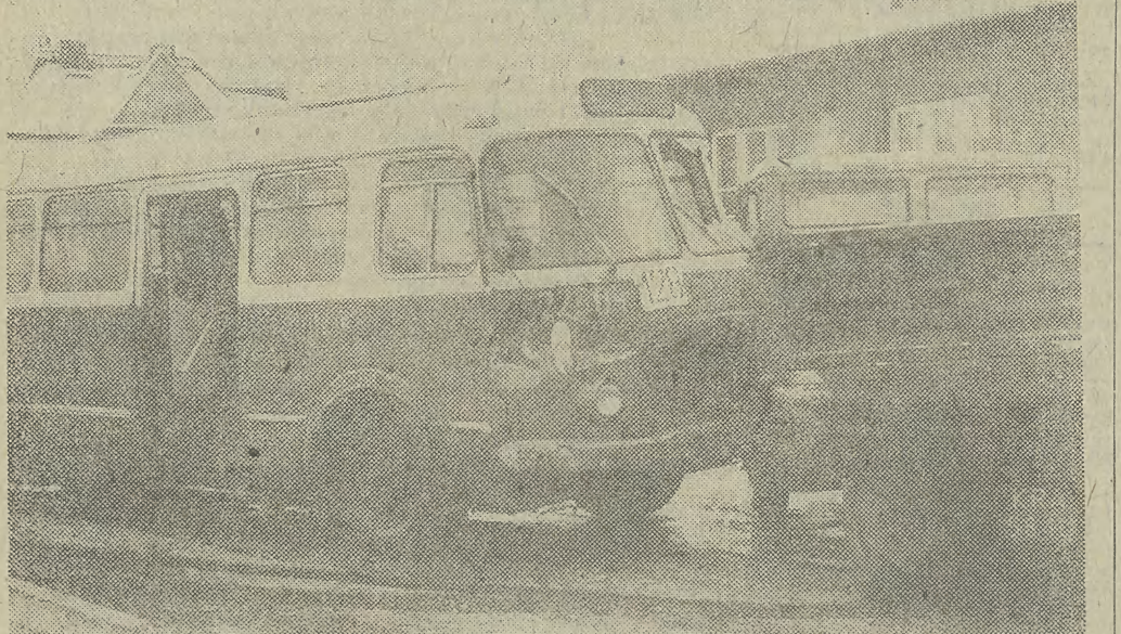
Tę krakę sfotografowaliśmy w końcu ubiegłego tygodnia. Nadal ślisko — a na gołębiedzi nie ma wielu moonych! Jedźcie ostrożnie!