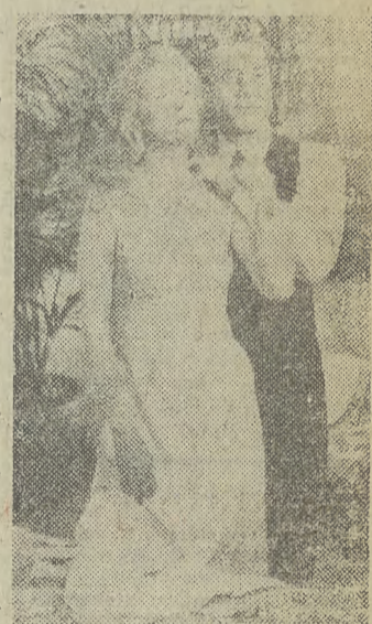
Fayé Dunaway i James Farentino odwarzają główne role w filmie telewizyjnym amerykańskiej pt. „Evita Peron”. Na zdjęciu F. Dunaway jako Evita Peron i J. Farentino jako prezydent Peron. Warto dodać, iż F. Dunaway nosi w tej scenie filmu biżuterię o wartości ponad 13 mln dolarów.