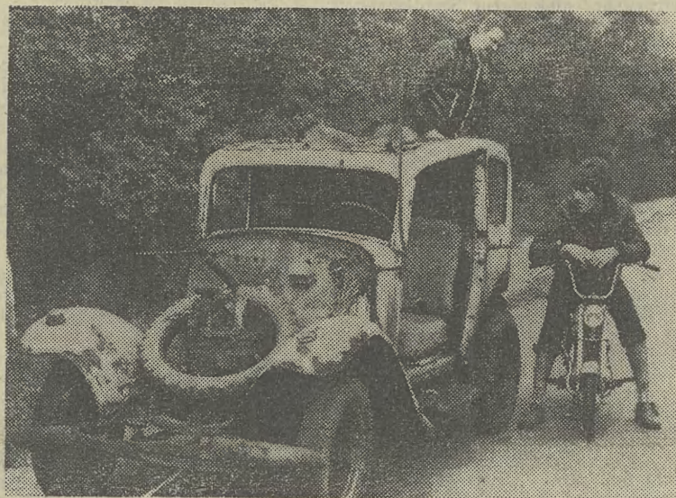
Może się na coś przyda...

Budowa „Daru Młodzieży” — następcy „Daru Pomorza” — postępuje w szybkim tempie, choć fundusze potrzebne do sfinansowania budowy nowego żaglowca są dalece niewystarczające. Mimo to przy pracach wyposażeniowych w Stoczni Gdańskiej im. Lenina codziennie zatrudnionych jest ok. 150 stoczników. Ale zanim armator przejmie „Dar Młodzieży”, trzeba za niego zapłacić Stoczni — po nowych cenach surowcowych — blisko 700 mln zł, gdy dotychczas na społecznym koncie budowy zgromadzono tylko ok. 200 mln i 120 tys. dolarów. Dla pozyskania dalszych funduszy planuje się m. in. wydanie specjalnej serii znaczków, albumu fotograficznego oraz przeprowadzenie dodatkowych gier liczbowych. A sprawa jest bardzo pilna, bo „Dar Młodzieży” powinien już w lipcu br. zameldować się na starcie do regat wielkich żaglowców świata — „Operacji Żagiel 82”. CAF