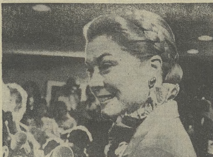
Kto to pamięta! Księżna Monaco, znana kinomanom jako Grace Kelly, na konferencji prasowej w Filadelfii, gdzie przybyła na festiwal swoich filmów.