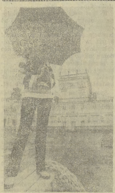
Miejmy nadzieję, że lato nie upłynie nam pod parasolem.

Przyglądam się, jak kilka pań w białych fartuchach przygotowuje