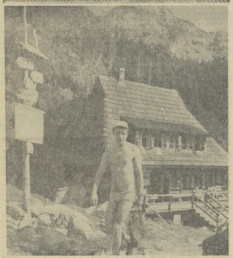
Schronisko na Hali Kondratowej to niejako pośrednia stacja na szlaku, którego celem jest Giewont. Tutaj zatrzymują się turyści, żeby się posilić i odpocząć przed zdobyciem szczytu.

Nie, proszę się nie obawiać, nie będzie o piłce nożnej. Będzie o surowcach. Braki surowców odczuwają teraz wszyscy — szczególnie surowców z importu. My, dziennikarze, nie jesteśmy wyjątkiem. Chociaż w „Echu” na przykład nie zabiegamy o surowce importowane. Wystarczą nam lokalne.