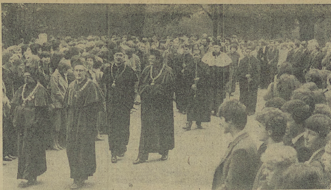
Tradycyjny pochód ul. św. Anny, Plantami do Collegium Novum rozpoczął nowy rok w UJ.