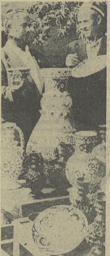
Bogato zdobiona ceramika tadzicka czerpie wzory m. in. ze znalezisk archeologicznych. Wyroby fabryki w Isfarze znane są w wielu krajach.