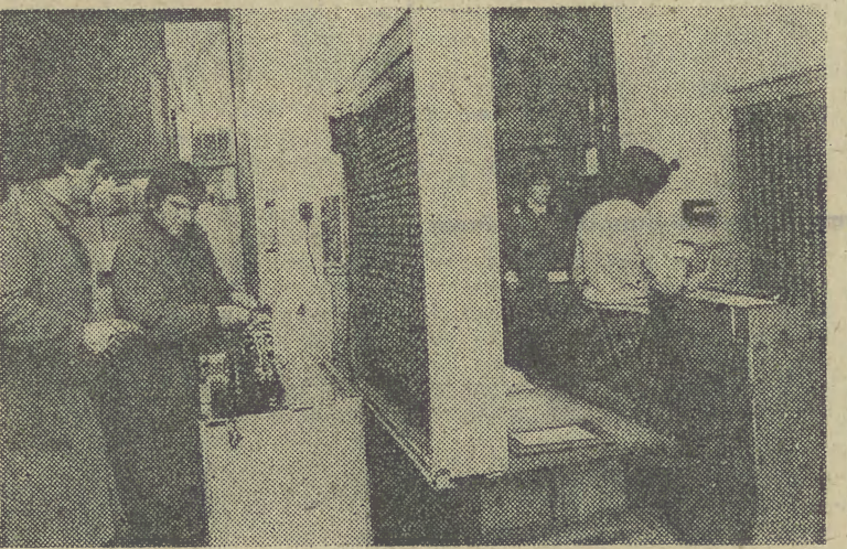
„Pautze” z 1927 roku mogłyby z powodzeniem przejść na emeryturę. Nie z tego, muszą przetrzymać tę podwyżkę cen i nie wiadomo czy nie następną...

Problem przerobienia płyt polega właśnie na zmianie wypukłości w sztyftach. One są zakodowane ceną biletu. Dodatkowy kłopot wynika z faktu, że zgodnie z nowymi taryfami ceny biletów (Dokończenie na str. 2)