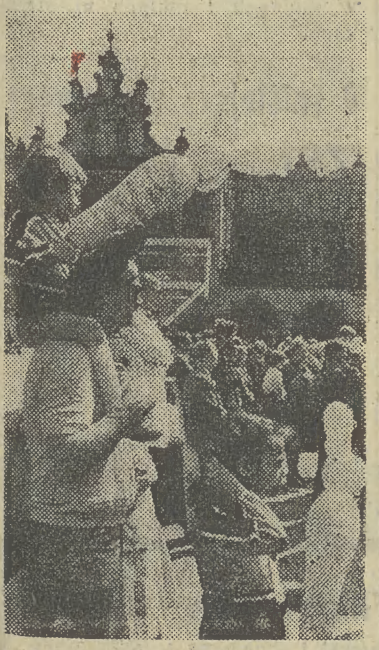
Podczas pierwszomajowej imprezy na Rynku Głównym.

Asamie, gdzie miejscowi nacjonaliści zwalczają napływową ludność muzułmańską, która kiedyś, była pożądaną siłą roboczą, a dziś, mając pełnię praw obywatelskich, może zyskać przewagę w wyborach stanowych, z czym miejscowi nie chcą się pogodzić. Inny problem, który spędza sen z powiek pani premier, to dążenia Sikhów do oderwania od Indii Pendżabu, konflikt praktycznie nie do rozwiązania. Pomniejsze problemy wewnętrzne, z jakimi musi się borykać, trzeba by długo wyliczać, ale najbardziej dotkliwy to bez wątpienia własna synowa, która manipulowana przez prawnicę oficjalnie rzuciła wyzwanie nie lubianej teściowej jako przeciwnik polityczny. 27-letnia Maneka Gandhi, była modelką i dziennikarką, utworzyła własną partię, groźną o tyle, iż jej przeciwnicy działacze wykorzystują zresztą pamięć zmarłego syna pani Gandhi — Sanjaya. I choć na razie trudno będzie jej zagrozić samej pani premier, na pewno może w przyszłości pokrzyżować plany jej następcy, starszemu synowi Rajiwowi, który robi obecnie szybką karierę polityczną w Partii Kongresowej. (l-k)