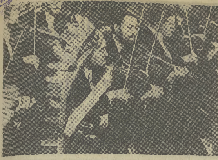
Niecodzienny koncert symfoniczny odbył się w Filharmonii Łódzkiej. Niecodzienny, bowiem podczas jego trwania muzycy zmieniali nakrycia głowy. Raz były to meloniki, innym razem myśliwskie kapelusze. Nie brakło nawet indiańskich pióropu-