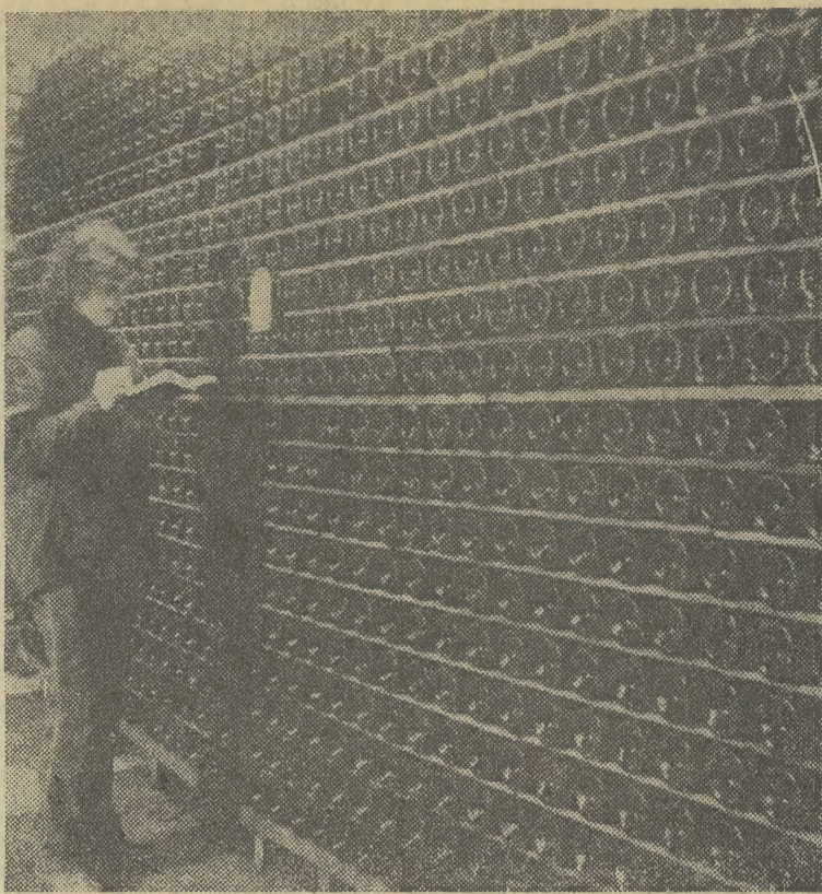
Wytwórnia szampana „Törley” w Budapeszcie obchodziła ostatnio 100-lecie. Na zdjęciu: leżakowanie szampana w piwnicach.