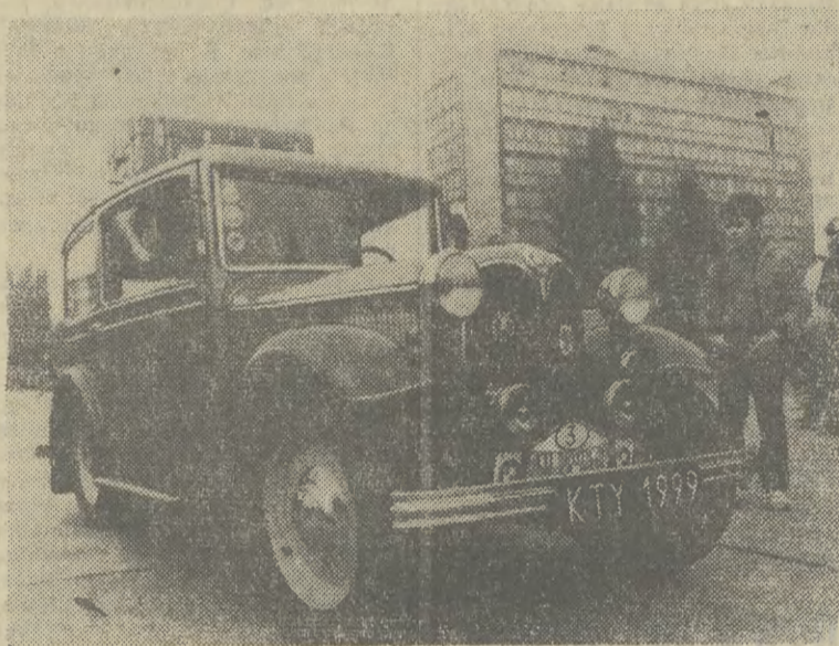
Zielone „bmw” z firanczkami w oknach, z oryginalną firmową walizką podrózną na dachu wzbudzało powszechne zainteresowanie.

Jak wynika z jego informacji, sytuacja w rolnictwie naszego regionu wygląda pomyślnie, bowiem żniwa zostały już zakoń-