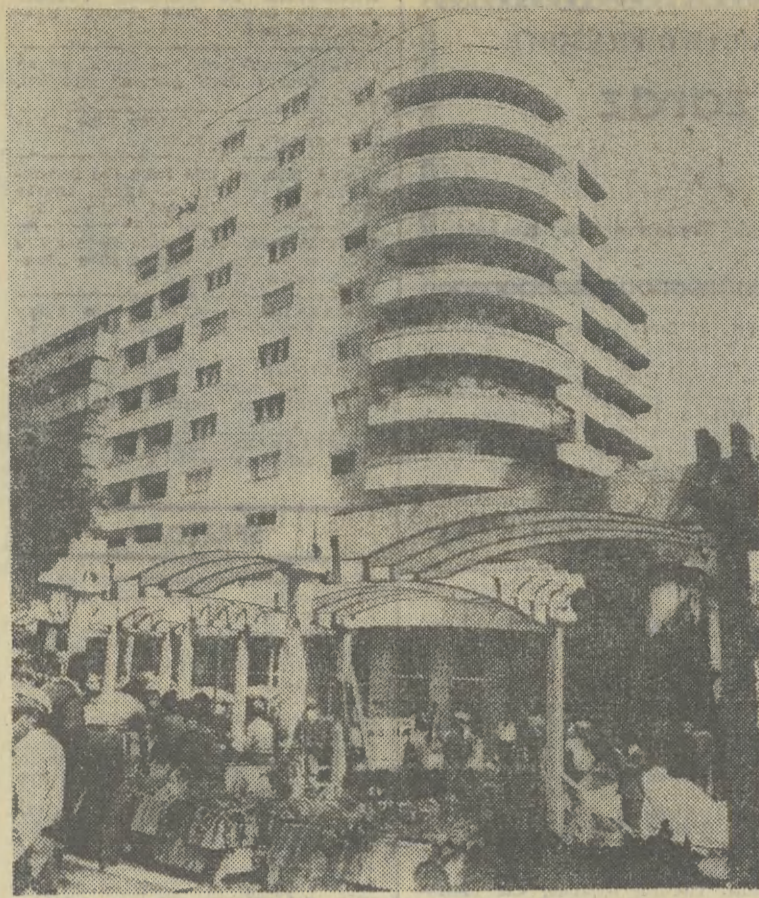
Migawka z centrum Bukaresztu.