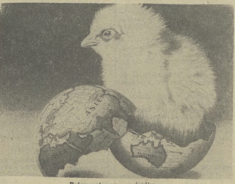
Byłem cały czas w środku...