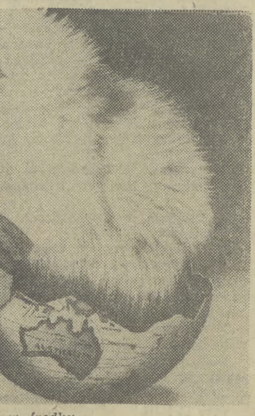
Byłem cały czas w środku...