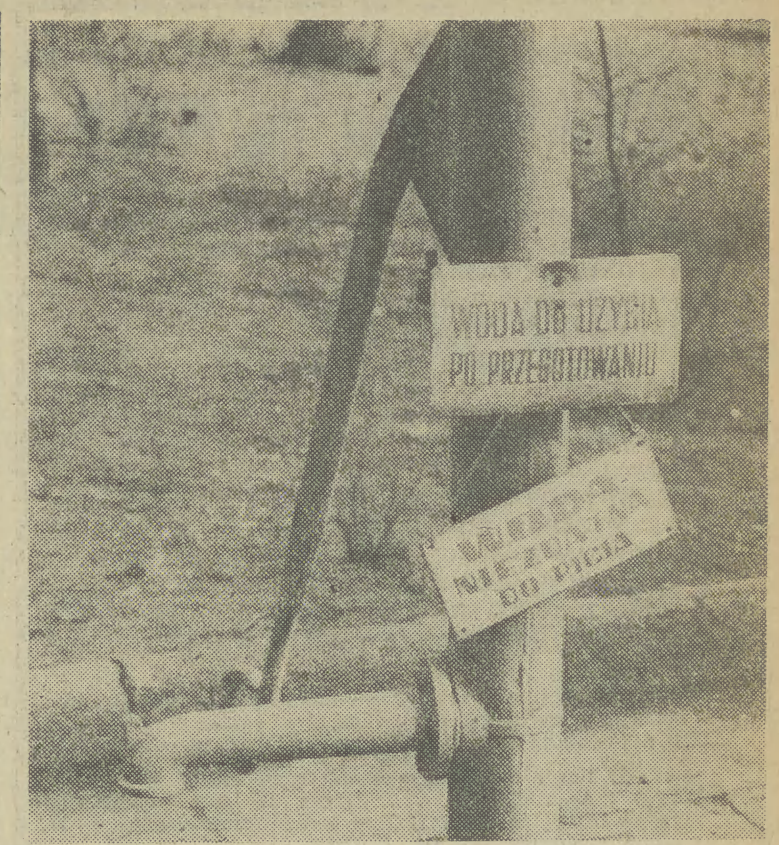
Tylko tak dalej.

Jest jeszcze informacja z przesyłanymi, że sklep nie pakuje towarów, które mają własne, oryginalne opakowanie. Ktoś bardziej unikliwy może się również dowiedzieć terminów ważności jaj chłodniczych, a także znaleźć instrukcję w sprawie zgłaszania terminu o wadach fizycznych artykułów żywnościowych. Jest też, ale to już chyba z myślą o klien-