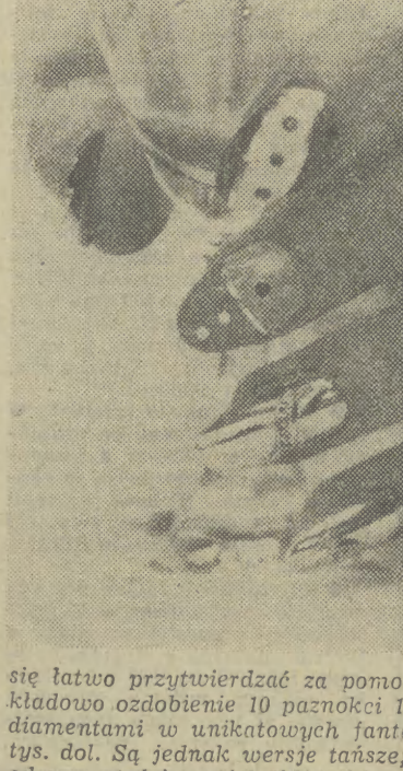
się łatwo przytwierdzać za pomocą specjalnego, silnego kleju. Przykładowo ozdobienie 10 paznokci 14-karatowym złotem i „wysadzenie” diamentami w unikatowych fantazyjnych wzorach kosztuje blisko 2 tys. dol. Są jednak wersje tańsze; wszystko bowiem zależy wyłącznie od zawartości portfela klientki... (Wi-Gr)

Kosztowna moda W zachodniej Europie szerzy się amerykańska moda „Nail Art” — sztuka na paznokciach. Przykładowo — na zdjęciu — salon piękności w Hamburgu poleca pokrywanie paznokci 14-karatowym złotem i „wysadzenie” klejnotami. Zgodnie z regulami, a praktycznie ich brakiem, każdy paznokieć winien być osobnym „dziełem sztuki”. Wśród proponowanych lakierów szczególnie modne są mieniące się całą gamą kolorów lakiery neonowe. Najmodniejszy sposób manicure wykonuje się nie tylko na paznokciach, lecz i sztucznych nakładkach, które dają