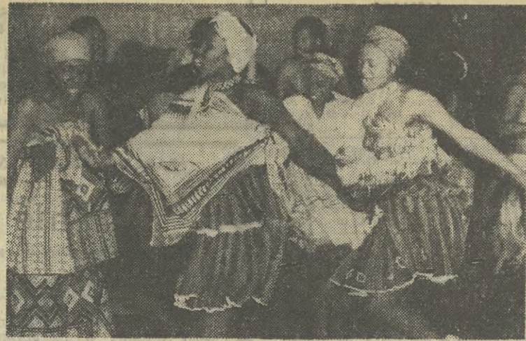
Na zaproszenie Rady Naczelnej ZSP przebywa w Polsce południowoafrykański zespół „Amandla”. W piątek wieczorem zespół wystąpił w nowohuckiej „Famie”, prezentując barwne, żywiłowe widowisko.