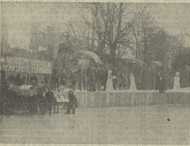
Akcja budowy naturalnych lodowisk przyniosła wspaniałe owoce. Były lata, że powstawały setki ślizgawek w Krakowie i województwie, obejmującym wówczas dużą część Polski południowej. Na zdjęciu: jedno z lodowisk laureatów konkursu w 1968 roku — ślizgawka w Białej Tatrztańskiej.

„Zabawy z Echem” opracował: Jerzy Langier