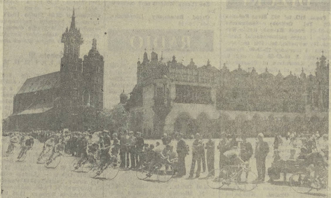
Kolarskie wyścigi o „Złoty pierścień Krakowa” ściągają do Rynku tłumy widzów. Cieszą się uznaniem samych kolarzy, dla których sygnet z herbem miasta jest atrakcyjną, pożądaną nagrodą. Na liście triumfatorów widnieją m. in. nazwiska takich sław, jak Ryszard Szurkowski i Stanisław Szozda.

Plebiscyty, w których wybieraliśmy najlepszych piłkarzy Krakowa odbywały się przez 10 lat i wywoływały spore zainteresowanie kibiców. Zwycięzcą pierwszego z nich został reprezentant Polski, zawodnik Wisły — Adam Musiał.