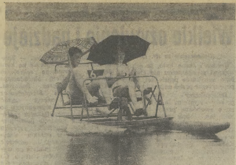
Mimo ulewnego deszczu ci dwaj młodzi ludzie postanowili nie przerywać przejażdżki po Kryspinowie. Rozpięli więc parasole...

OTO CENY wywoławcze na wczorajszej giełdzie samochodowej: ●126 Bis — 2,3 tys. bonów (tylko kosztuje oficjalnie i bez kolejk) lub 3,0—3,2 mln zł; ●126p FL — 88 r. — 1650 bonów, 87 r. — 2,1 mln zł, 86 r. — 1,75 mln, 85 r. 1,7 mln, 83 r. — 1,1—1,3 mln, 82 r. 1—1,2 mln, 76 r. 520 tys.; ●125p — 88 r. od 2,9 tys. bonów do 3,1, zaś składaki od 2,5 mln zł do 2,9 tys. bonów, 86 r. 2,2 tys. bonów, 73 r. 750 tys.; ●polonez — 88 r. 1,5 SLE — 5 tys. bonów (w tym podatek), ale były egzemplarze po 4,6 tys., a starszy typ — 4,3 tys. bonów, 86 r. — 4 tys. bonów i 5,5 mln zł, 84 r. — 2,8 tys. bonów; ●lada — nowiutka 2107 — 4,8 tys. bonów, 86 r. — 4,8 mln, 82 r. 2,7 mln; ●warburg — nowiutka „tourist” 3 tys. bonów, 86 r. 3,1—3,2 mln, 84 r. — 2,8 mln; ●zastawa — 81 r. 1,2 mln, 80 r.