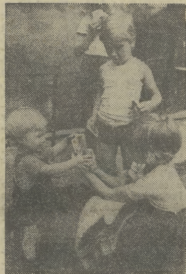
NA NAUKĘ gry w karty nigdy nie jest za wcześnie...