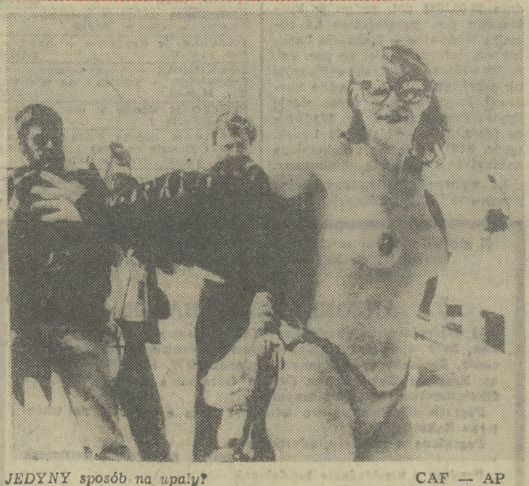
JEDYNY sposób na upał?

TRZEJ nieznanymi do tej pory sprawcy dokonali 3 bm. ok. godziny 4 nad ranem, przy użyciu broni palnej napadu na stację CPN w Mszczach k. Piotrkowa Trybunalskiego, rabując z kasy stacji ok. 100 tys. zł i magnetofon. Oddając strzały, zranili strumem jednego z 2 pracowników stacji. Zbiegli, postępując się motocyklem MZ. Ranny pracownik stacji przebywa w szpitalu. Trwa intensywna akcja milicyjna.