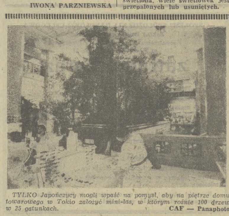
TYLKO Japończycy mogli wpaść na pomysł, aby na piętrze domu towarowego w Tokio złożyć mini-las, w którym rośnie 100 drzew z 25 gatunkami.