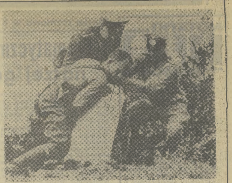
WRZESIEŃ 1939 — obalanie słupów granicznych przez żołnierzy niemieckich