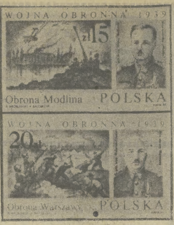
Obrona Modlina POLSKA 15 zł. Obrona Warszawy POLSKA 20 zł.