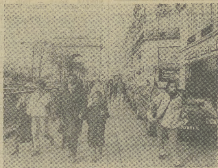
PARYŻ. Na Polach Elizejskich w pobliżu Łuku Triumfalnego czuć już wiosnę...