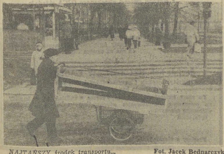
NAJTANSZY środek transportu...

Sprzedż w Oddziale ORBISU w Krakowie przy pl. Szczepańskim 3 oraz we wszystkich Oddziałach Polskiej południowo-wschodniej.