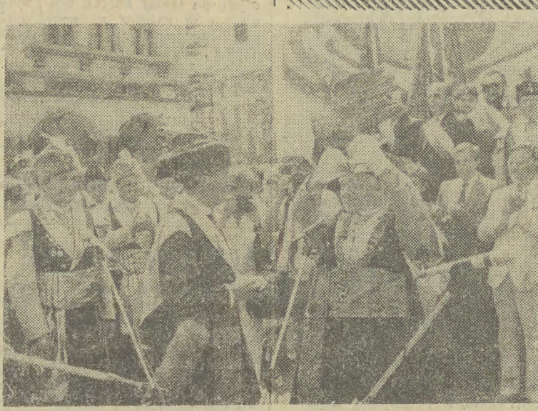
FRAGMENT występu izraelskiej grupy baletowej.