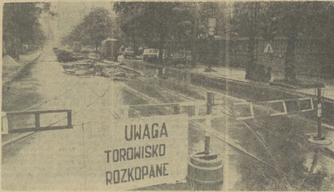
OD kilku dni trwa remont torowiska na ulicy Labecz. Na razie postępuje opieszale. Wczoraj po godz. 13 nie dostrzeżliśmy przy pracy ani jednego robotnika.

Dziwne zwyczaje panują na Woli Justowskiej. Wszędzie wokół willi żądane ogródki, ale już za ogrodzeniem, przy ulicy o porządek i zadbane trawnik trudno. Np. wzdłuż ul. Królowej Jadwigi tylko przed nielicznymi posesjami trawa jest skoszona.