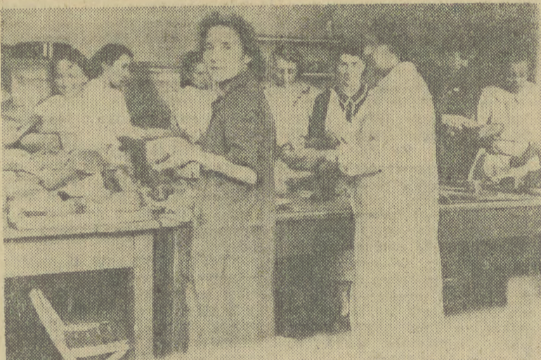
DZIS o godz. 18 w Galerii Fotografii NCK otwarta zostanie wystawa składająca się ze zdjęć wykonanych w czasie okupacji przez Henryka Kabata, a obrazujących działalność „Patronatu” czyli Sekcji Opieki nad Więźniami i ich Rodzinami Polskiego Komitetu Opiekuńczego. Powyżej — jedno ze zdjęć z wystawy.

Sobota: „Pocaltuak pantery” — horror. Młody inżynier zakochuje się w Irenie — dziewczynie, która spotyka w ZOO. Chciałby się z nią ożenić, lecz miłość kobietę zmienia w panterę. Wybory Miss Italia — edycja 1989 r. — odbywała się corocznie od 1939 r. W jury zasiada najbardziej znane Miss Włoch z lat ubiegłych. Głosować będą także widzowie. (kk)