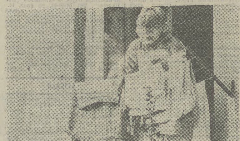
OBWIESZONE praniem okna i balkony to już normalny obrazek w nowych osiedlach. W tych blokach nie ma suszarni...

NA zakończonej w San Sebastian XXXVII międzynarodowym festiwalu filmowym jedną z głównych nagród — „Srebrną Muszla” — otrzymał (za najlepszą reżyserię) Mirosław Bork za film „Konsul”. Ten debiut fabularny reżysera (z Piotrem Fronczewskim w roli głównej) oparty został na głośnej przed laty aferze oszusta Silbersteina. Ex aequo „Złota Muszla” otrzymał „Homer i Eddie” Andrieja Konczalowskiego (USA) oraz „Nationlandestina” Jorge Sanjinesa (Boliwia). (PAP)