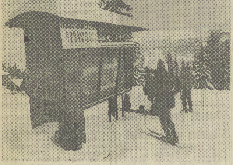
Jechać czy nie jechać? Zakaz jest, ale jak dotrzeć na dół? Kolejka nie bardzo przecież wypada...