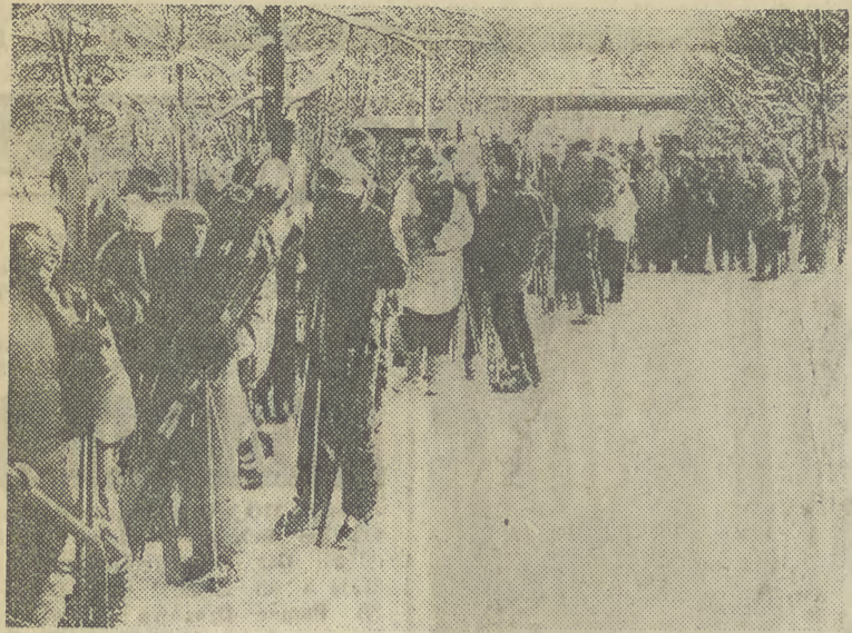
Choć trasa z Gubałówki zamknięta, chętnych do jazdy i łamania zakazu (oraz nóg) nie brakuje...