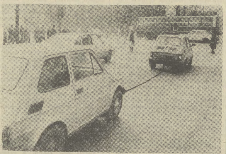
NAUKA jazdy jest dobra na wszystko... jak trzeba to i poholuje!