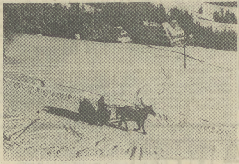
Z wyciągu krzesełkowego na Butorowy Wierch doskonale widać niebezpieczne skrzyżowanie drogi dojazdowej z trasą narciarską.

Najlepszym tego przykładem jest zachodni stok Gubałówki — Butorowy Wierch. Zbudowano tu wyciąg krzesełkowy, mający w założeniu, stanowić kolejkę-bazę, która wywozi narciarzy w górę i tam mają oni do jazdy szereg orczyków. Plan był piękny. Tyle że został na papierze. A prakty-