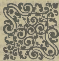
Na tonie natury najuspanialej...