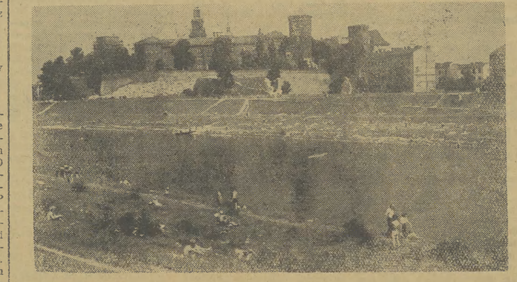
W dni słoneczne — przede wszystkim w niedzielę — ulubionym miejscem odpoczynku krakowian jest piękny odcinek Wisły u stóp Wawelu. Amatorzy wody i słońca mają tutaj rozczepione „wypłynie”. Można tu bez większego bólu przypomnieć sobie minione już urlopy i wczasy, można też z przyjemnością pomyslić o tych, które dopiero nastąpią.

W dni słoneczne — przede wszystkim w niedzielę — ulubionym miejscem odpoczynku krakowian jest piękny odcinek Wisły u stóp Wawelu.