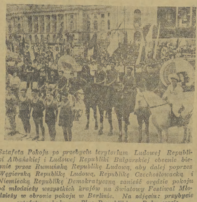
Sztafeta Pokoju po przebyciu terytorium Ludowej Republiki Albańskiej i Ludowej Republiki Bułgarskiej...