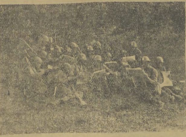
CAF - AFWP