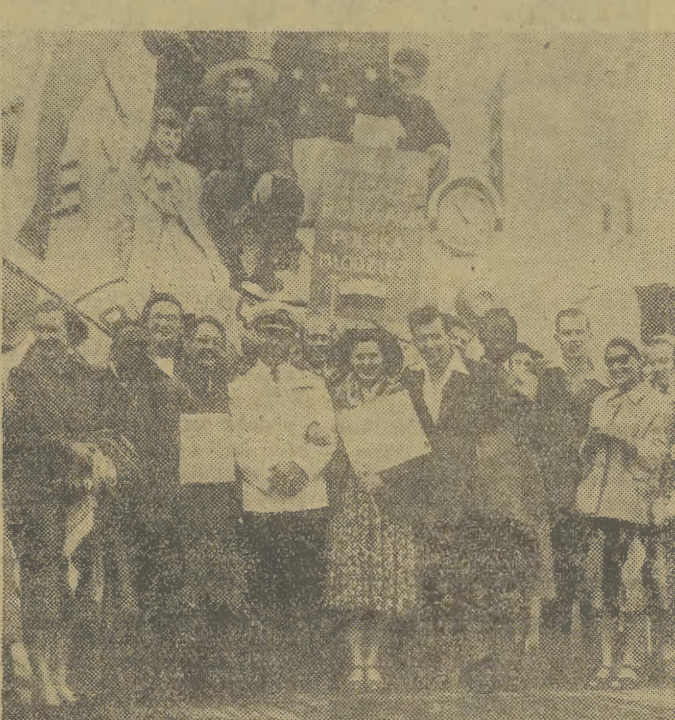
Na zdjęciu: delegacja młodzieży brytyjskiej w drodze na Światowy Złot na południe MS „Batory”