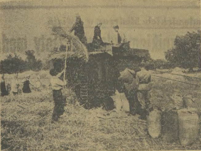
Żołnierze Ludowego Wojska Polskiego podjęli zobowiązanie wzięcia pomocy przy pracach omlotowych w gromadzie Kania-Nowy, woj. warszawski...