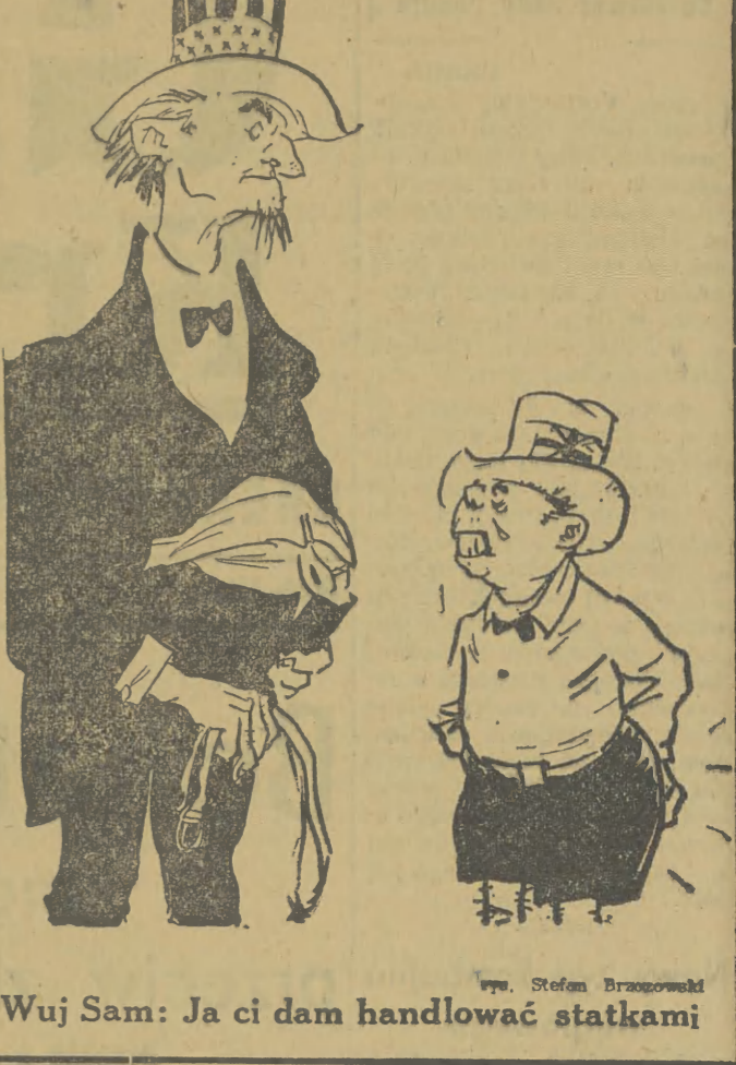
Na rozkaz Waszyngtonu rząd angielski dokonał rekwiizycji dwóch statków wykonanych dla Polski i już zapłaconych.