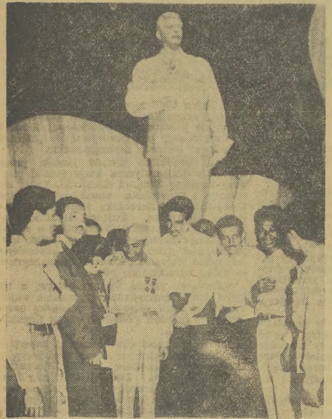
W ramach Złota otwarta została w Berlinie wystawa ZSRR. Na zdjęciu: delegaci z Wietnamu, Brazylii i z Ekwadoru zwiedzają wystawę