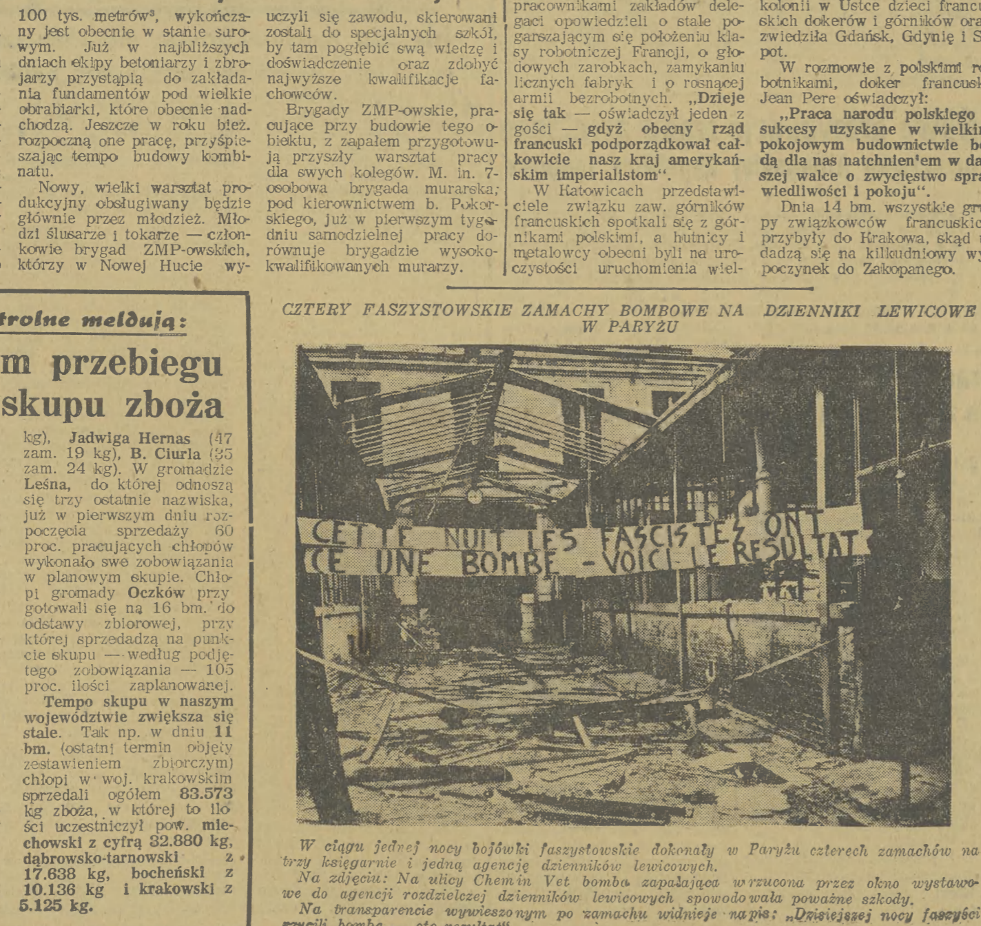
W ciągu jednej nocy bojówki faszystowskie dokonały w Paryżu czterech zamachów na trzy kwaterki i jedną agencję dzienników lewicowych.