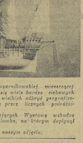
Na Ogólnopolskiej Wystawie Kopernikowskiej mieszczącej się w Collegium Maius znajduje się wiele bardzo ciekawych eksponatów...