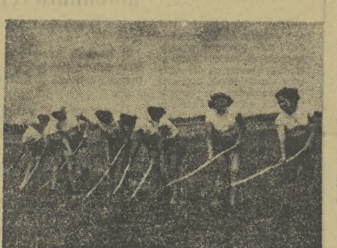
Młodzieżowa Brygada SP coraz liczniej przychodzi z pomocą naszym robotnikom, oddając ogromne usługi szczególnie w tych branżach, na których dotkliwie odczuwa się brak rąk do pracy. Na zdjęciu: junacy SP z woj. krakowskiego przy pielęgnacji bruków cukrowych na placach PGR Rusocin (woj. śląskie) wyrabiają przeciętnie 130 proc. normy.

Pragnąc podnieść jakość pracy, załoga stacji krakowskiej wystąpiła z inicjatywą wysłania listów gwarancyjnych na remontowane przez siebie samochody.