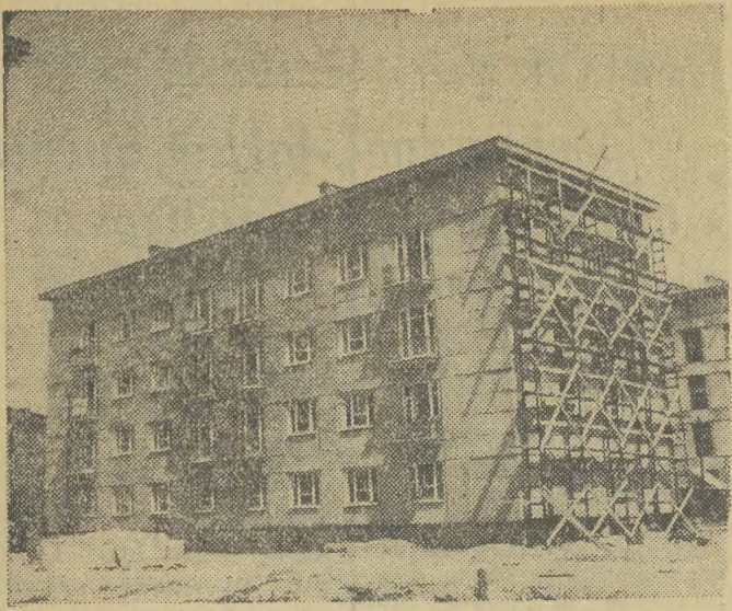
Oto jeden z domów nowohuckich wybudowany całkowicie z prefabrykatów.