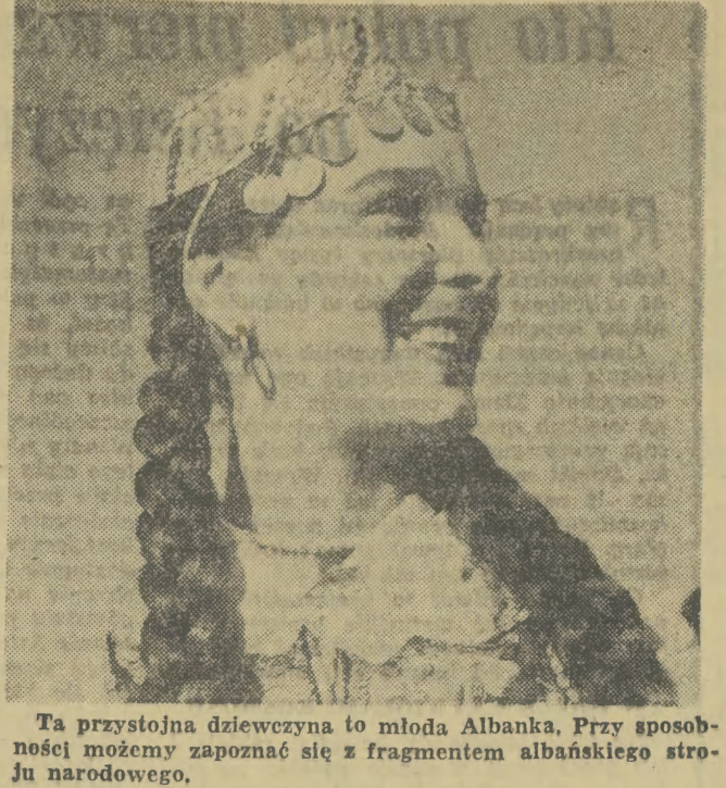
Ta przystojna dziewczyna to młoda Albanka. Przy sposobności możemy zapoznać się z fragmentem albańskiego stroju narodowego.

Jeszcze przed 10 dniami przysłał do Stacji Oceny Nasion w Krakowie próbkę rzepaku ozimego. Wynik jest doskonały — rzepak nadaje się do reprodukcji. Dlaczego wobec tego nie wysłał ziarna chłopot z pow. miechowskiego i olkuskiego, którzy zakontrowali rzepak? Czyżbyście do Stacji Oceny Nasion przysłałi wycyzszone ziarno, a resztę musicie dopiero przygotowywać? Przypominamy, że rzepak przysyłany do Stacji musi być taki sam, jak ten, który pozostał u Was w magazynach. I na taki właśnie czekają chłopi z Miechowskiego i Olkuskiego. (eg)