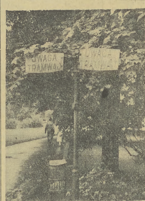
Tablice ostrzegawcze z napisem: „Uwaga, tramwaj” ustawione vis a vis Banku Rolnego są docelne nie tylko dla osób znajdujących się na jezdni. A przecież mają one ostrzegać tych, którzy wychodzą z Plant. W tym wypadku nie spełniają swego zadania, gdyż zasłaniają je drzewa.