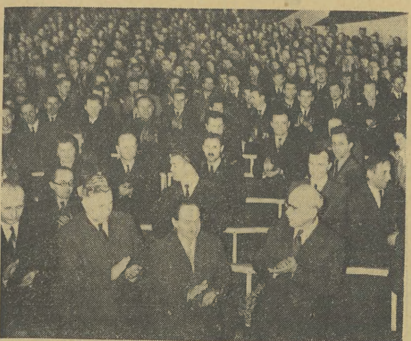
26 II 1958 r. w Sali Kongresowej Pałacu Kultury i Nauki w Warszawie rozpoczął trzydniowe obrady XI Krajowy Zjazd Związku Młodzieży Wiejskiej...

ORGAN KOMITETU WOJEWÓDZKIEGO POLSKIEJ ZJEDNOCZONEJ PARTII ROBOTNICZEJ W KRAKOWIE