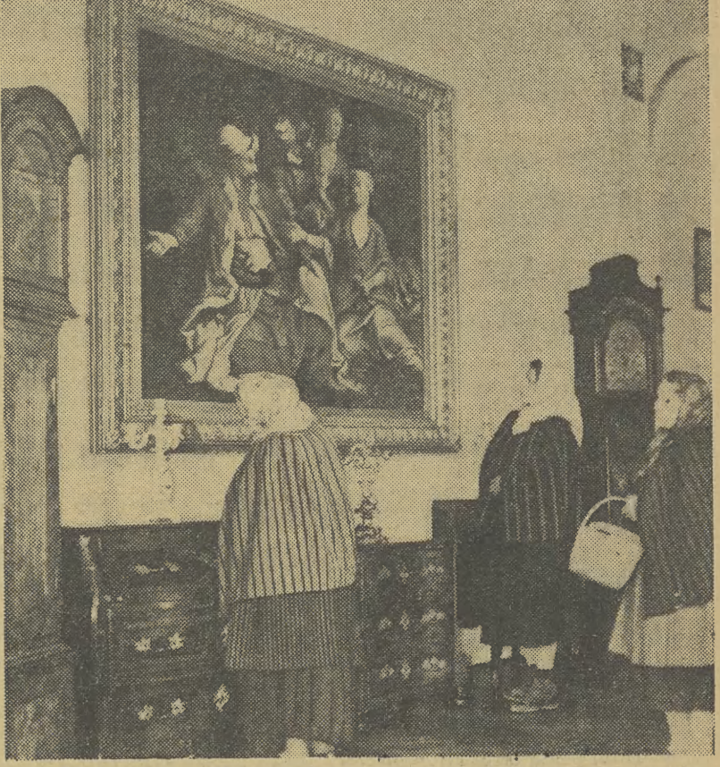
Poszczególne działy Muzeum Świętokrzyskiego w Kielcach jak: sztuka, etnografia, archeologia i geologia cieszą się dużym powodzeniem mieszkańców miasta i województwa...