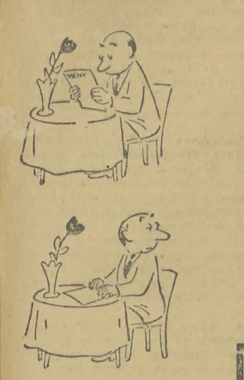
Nie ruszać się!