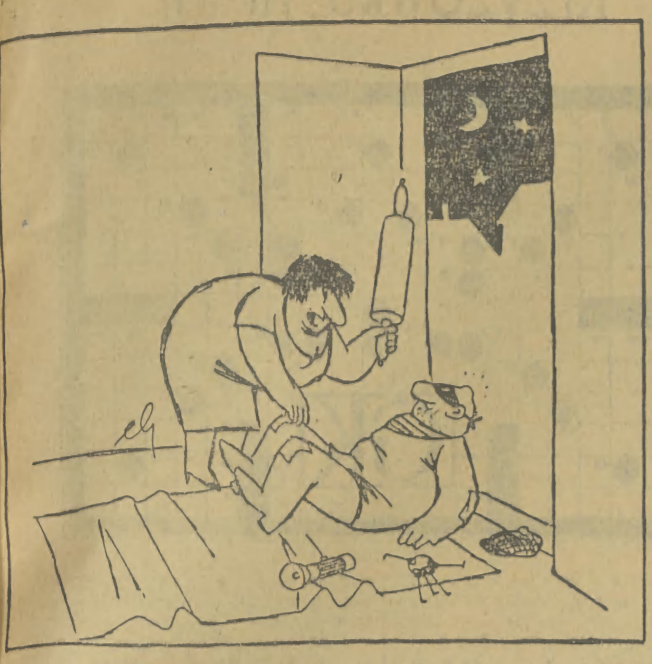
Bardzo pana przeproszam, myślałam, że to mój mąż!...