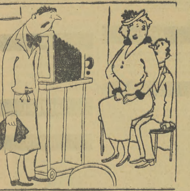
Taki piękny jak jesteś, to Cię na fotografii będzie dość widać.