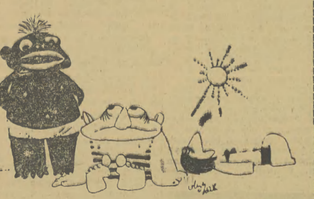
Pan się ładnie opalił — Ja jestem Murarzem