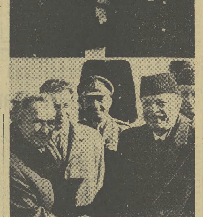
Na zdjęciu u góry: premier Shastri i premier Kosygin na lotnisku w Taszkencie. Natomiast na zdjęciu u dołu: moment powitania prezydenta Ayub Khana.

TASZKENT (PAP) W hotelu „Taszkient” odbyły się we wtorek osobne kon-