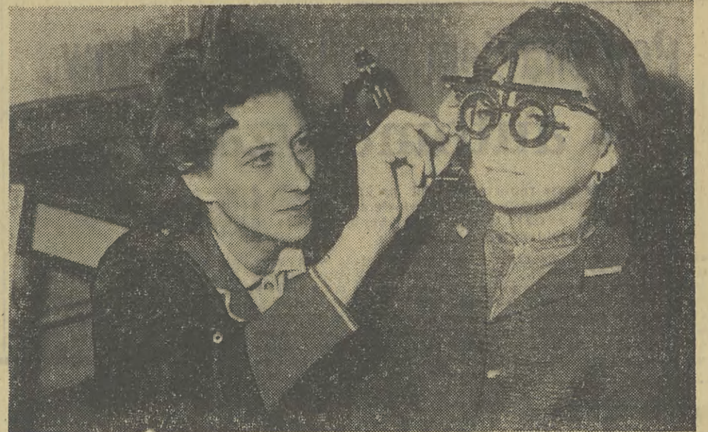
Podczas tegorocznej wystawy prototypów, dwa eksponaty ze Śląskich Zakładów Mechaniczno-Optycznych „Opta” w Katowicach: oftalmoskop oraz oprawa probiercza OPR-U oddaje duże usługi przy doborzeniu szkieł okularowych.

Niewiele ponad 4 lata temu, w dniach XXII Zjazdu KPZR do prezydium Zjazdu nadszedł taki telegram: „Pierwsza partia diamentów — gotowa. Zadanie na rok 1961 przekroczone 4-krotnie”. Nadawcą była kijowska załoga Instytutu materiałów superciężkich, odznaczona orderem Czerwonego Sztandaru. Kolektyw, który stworzył podwaliny radzieckiego przemysłu diamentów syntetycznych. Wiadomość przyjęta została z zainteresowaniem przez specjalistów w skali światowej. Angielska prasa np. zmuszona była przyznać, że fakt jest „bardzo ważnym zdarzeniem w przemyśle diamentowym”. Dziś w instytucie specjalna mapa pokryta jest tak gęstą siatką linii, że niewiele spod nich widać. Pod mapą widnieje cyfra 3212. Obrazuje ona ilość organi-