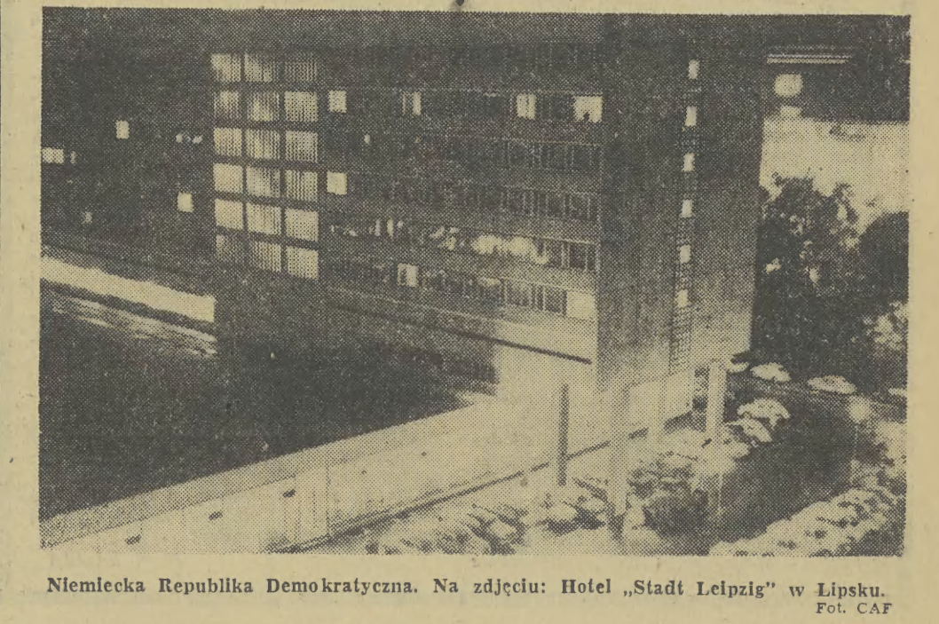
Niemiecka Republika Demokratyczna. Na zdjęciu: Hotel „Stadt Leipzig” w Lipsku.

WARSZAWA (PAP) Pogotowie lotnicze spieszy z natychmiastową pomocą lecnicznictwu w najbardziej palących sytuacjach. Blisko 6 tys. lotów — to plan ub. roku. Stacje pogotowia lotniczego istnieją w wszystkich województwach z wyjątkiem Opola i Łodzi. Dysponują one blisko 80 samolotami i 10 śmigłowcami. Od blisko 3 lat trwa modernizacja wyposażenia pogotowia lotniczego. Dotychczas nowy sprzęt w postaci samolotów „Super-Aero” i „Morava” sprowadziliśmy z Czechosłowacji. Obecnie przecho-