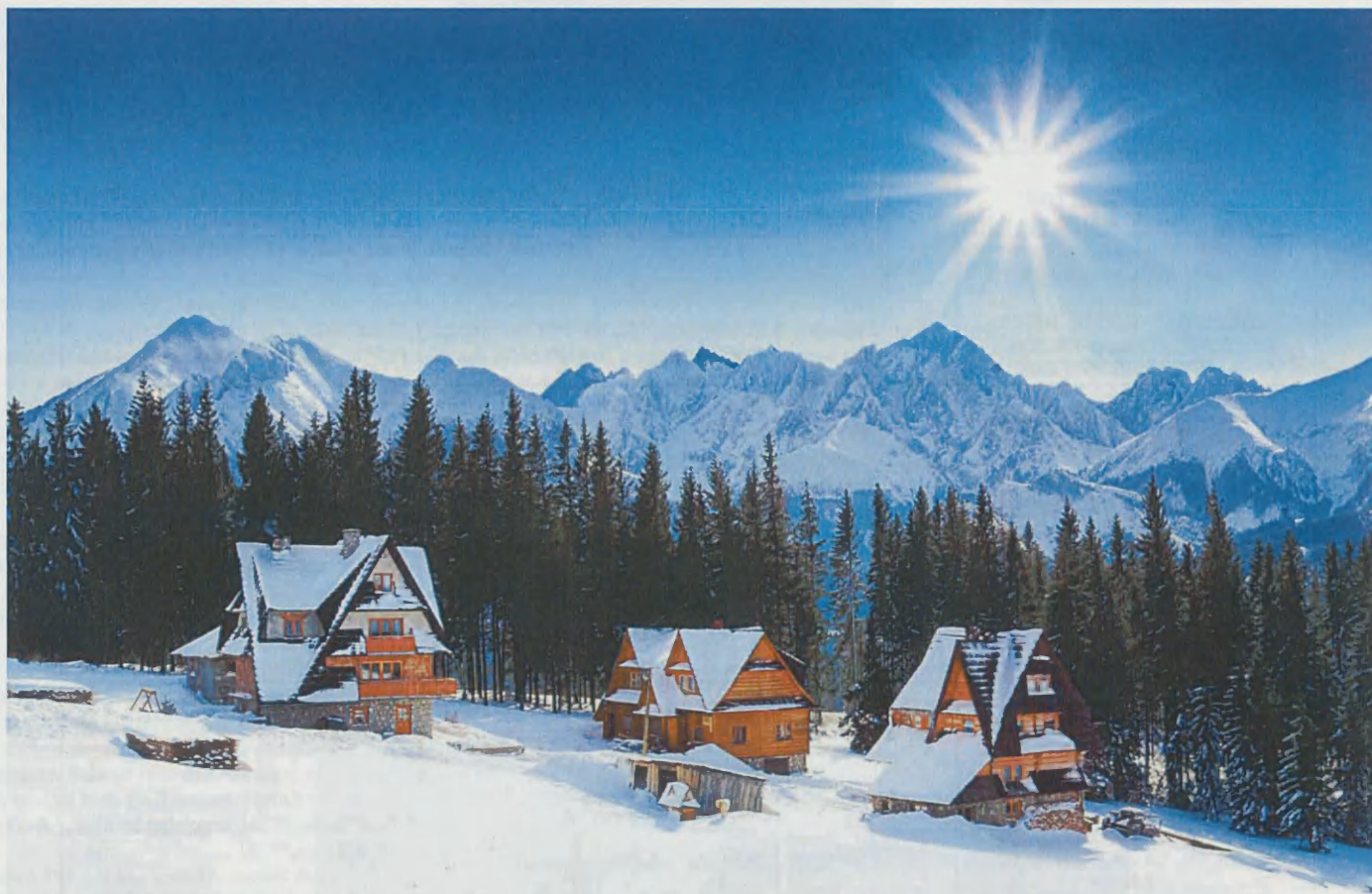
Tatry. Widok z Polany Głodówka.