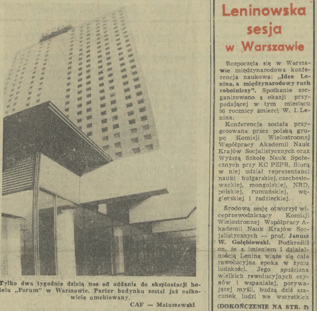
Tylko dwa tygodnie dzieli nas od oddania do eksploatacji hotelu „Forum” w Warszawie. Parter budynku został już całkowicie umebłowany.

— Trzeba podkreślić, że przychodząca, w jakimś momencie, przemysł samochodowy w świecie zachodnim, jest nie tylko kryzys naftowy. — Głównym i zaostrzającym się z roku na rok problemem staje się rosnący deficyt surowców i materiałów i związany z tym wzrost ich cen, zwłaszcza stali.