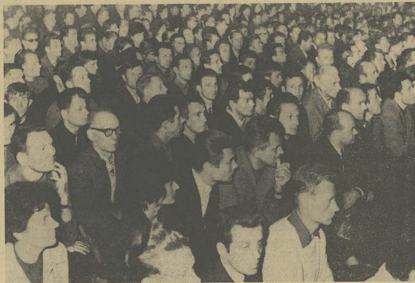
Mieszkańcy Nowej Huty niezwykle serdecznie powitali premiera Józefa Cyrankiewicza kandydata na posła do Sejmu PRL.