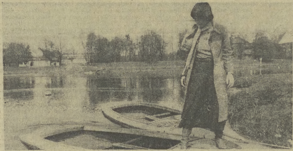
Jesienny spacer w jesiennym pejzażu.

12, 13. XI. 1977 R. ● NR 258 (9184) ROK XXIX ● CENA 1 ZŁ ● WYD. A.