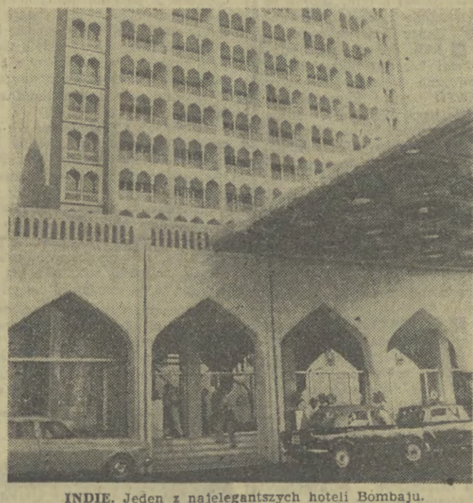
INDIE. Jeden z najelegantszych hoteli Bombaju.

Coraz więcej kombajnów pojawia się ostatnio na zbożowych łanach gospodarstw państwowych. (DOKOŃCZENIE NA STR. 2)