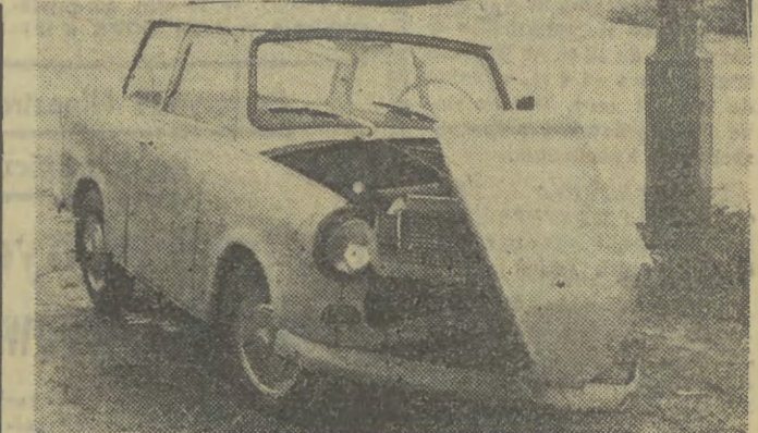
Dziś — jak w każdą sobotę — na drogi całego kraju wyruszają zreszcie zmotywowanych turystów. Apelujemy o rozważanie i rozsądek na szosie! Wszyscy chcą spokojnie i pomysłnie wrócić do domu w pełnym zdrowiu i na sprawnych 4 kółkach...

Według informacji ogłoszonych w piątek przez Federalny Urząd Kryminalny w Wiesbaden, broń, którą posłużyli się terrorystki uczestniczący w porwaniu i zamordowaniu Moro pochodziła z tej samej wytwórni, w której zaopatrywali się mordercy Hannsa Martina Schleyera.