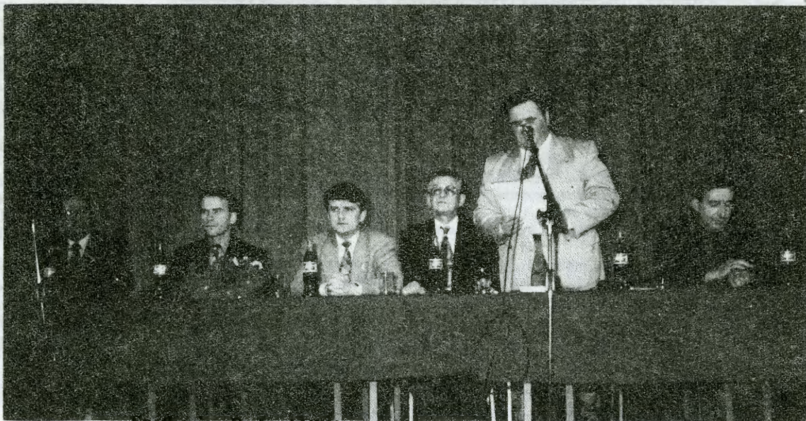
Spotkanie z Posłami KPN w Miejskim Ośrodku Kultury w Wolbromiu.

Posłowie wysłuchali wszystkich próśb oraz pytań z sali. Starali się odpowiedzieć na wszystkie, po czym udadli się do Kopalni "Wujek".