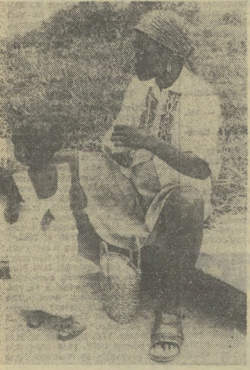
Luanda — stolica Angoli. Odpoczynek w drodze po zakupy.