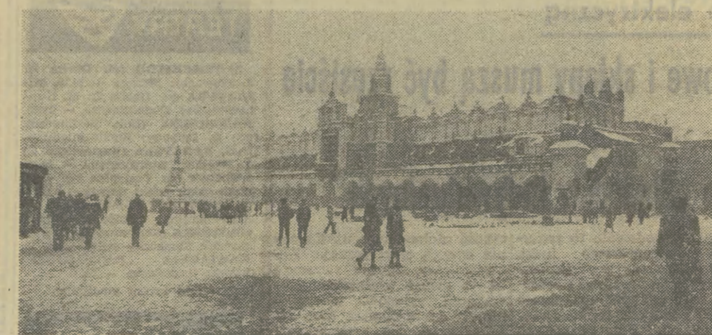
Od tygodnia Rynek Gł. w Krakowie w przeważającej mierze objęli w posiadanie piesi. Samochodom w obrębie centrum miasta pozostały nieliczne ulice. Nie wszyscy jednak kierowcy podporządkowali się obowiązującym znakom. Ale wczoraj zauważyliśmy, iż zaczęło konsekwentnie egzekwować przepisy.

Wszystko to będzie także prezentacją literatury zachodnich. Lista utworów amerykańskich pisarzy obejmuje np. ok. 30 tytułów, a angielskich — ok. 80. Znajdzie się na niej wiele