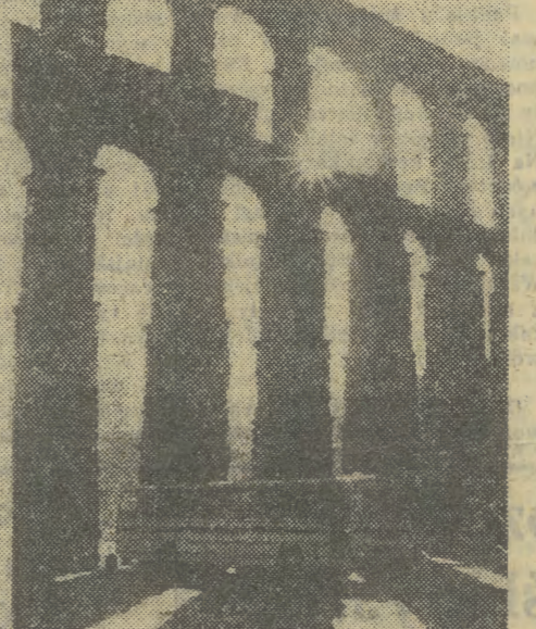
Serowia — słynny rzymski akwedukt. Funkcjonuje od dwóch tysięcy lat; ma 728 m długości, w centrum miasta osiąga największą wysokość 29 metrów.

(Inf. wł.). Ponad 300 twórców i działaczy kultury gromadzi klub „Kuźnica”, który zorganizował w minionym roku niejedno niezapomniane spotkanie i co najmniej kilkadziesiąt pamiętnych imprez. „Kuźnica” do swych inicjatyw dołączyła w 1978 roku nowa: zaczęła wydawać własną publikację „Zdanie”, przyjęła do dużym zainteresowaniem w całym kraju. W minionym roku zapoczątkowano też cykl spotkań środowiskowych twórców, na których dyskutują o ich problemach, kłopotach, ambi-tych. Pierwsze ze spotkań odbyły już ludzie teatru a w następnej kolejności spotykają się literaci, plastycy, muzycy i dziennikarze.