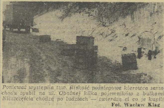
Ponieważ wystąpiła tzw. śliśisko pośniegowca kierowca samochodu zgnubił na ul. Obożej kilka pojemników z bułkami. Nieszczęśliwie chodził pod łudziach — twierdziła ci co je kupił!

Dlatego, że wszystkie parkinki, prowadzone w Krakowie przez spółdzielnie inwalidów lub „Wawel-Tourist” są zawołane po osie samochodów (i używane) niegłęboko. Wczoraj kierownik zdenudowanemu niemożliwością najpiękniej widać, czego dokonano po 2-3-minutowym „bukawaniu”, nie mogli potem bez pomocy przygodnych przechodniów wyjechać z zasp, które się nazwały parkینگami. Sytuacja powtarza się co roku. Śnieżny, Pod Filharmonii pracownicy parkingu usiłovali nawet poprosić kierownika samochodu-pluga o oczyszczenie zafek i służy głównego parkingu, ale go żądają za tę usługę 500 złotych! Ustawienie śniegu z parkingów nie może być wykonywane czynem społecznym, ponieważ prowadzą je przedsiębiorstwa, które biorą za usługę parkowania pieniądze. (J)