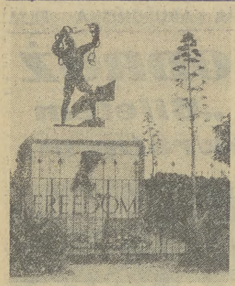
Pomnik Niepodległości w stolicy — Lusace.