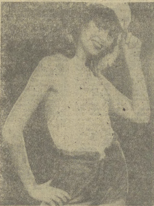
Moda dla kibiców piłkarskich na upały