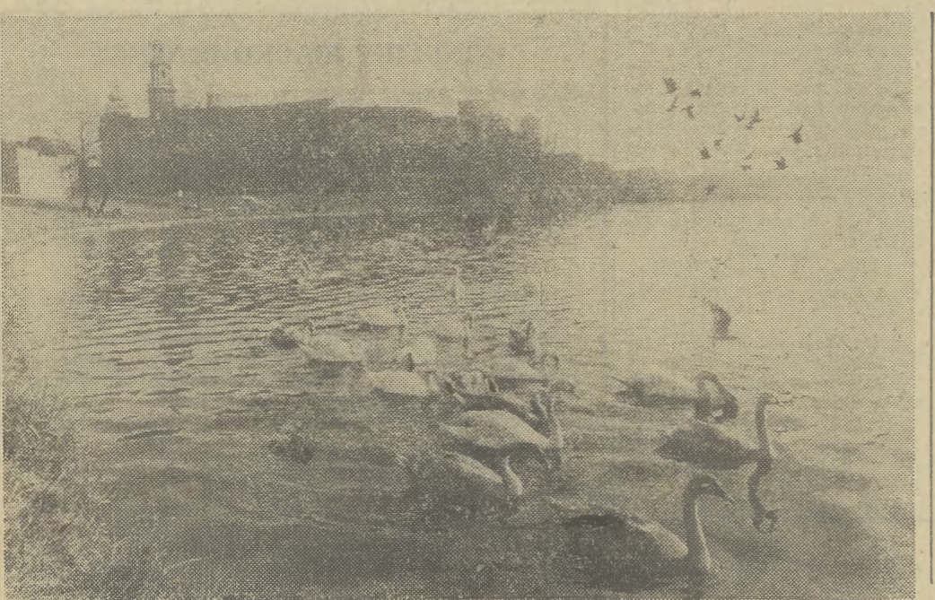
Wielka atrakcja Krakowa jest duże stado łabędzi, które pływa w zakolu Wisły pod Wawelem. Królewskie ptaki odczuły również świąteczną atmosferę, dokarmiane przez licznych krakowian łakociami ze świątecznych stołów.