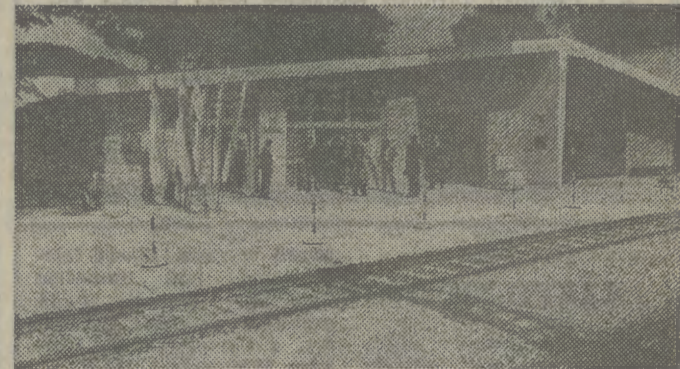
Nowy budynek punktu odpraw celnych w Muszynie.

(Inf. wł.) Stacja kolejowa w Muszynie jest ważnym punktem na granicy polsko-czechosłowackiej. Tędy wiedzie najkrótsza droga pociągami z Polski na Bałkany i do państw południowej Europy. Jedzie tu bardzo wiele podągów towarowych. Tym szlakiem kursują również trzy międzynarodowe ekspresy. Odprawa pasażerów odbywa się praktycznie tylko w godzinach nocnych, bowiem tak ułożony jest rozkład jazdy przekraczających granicę w Muszynie pociągów: „Cracovia”, „Karpacz” i „Warna”. Oddział celny w Muszynie, którego pracą (DOKOŃCZENIE NA STR. 2)