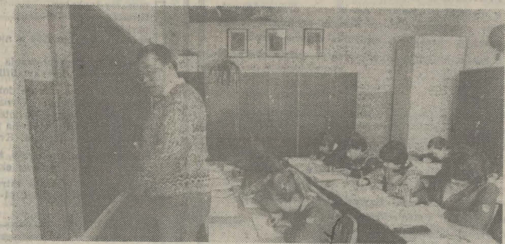
Sala lekcyjna w Szkole Podstawowej w Wolicy.

W pobliskim osiedlu Wycią- że, również warunki podobne, chociaż szkoła powstała w la- tach 50. Lekcje gimnastyki prowadzone są na korytarzu,